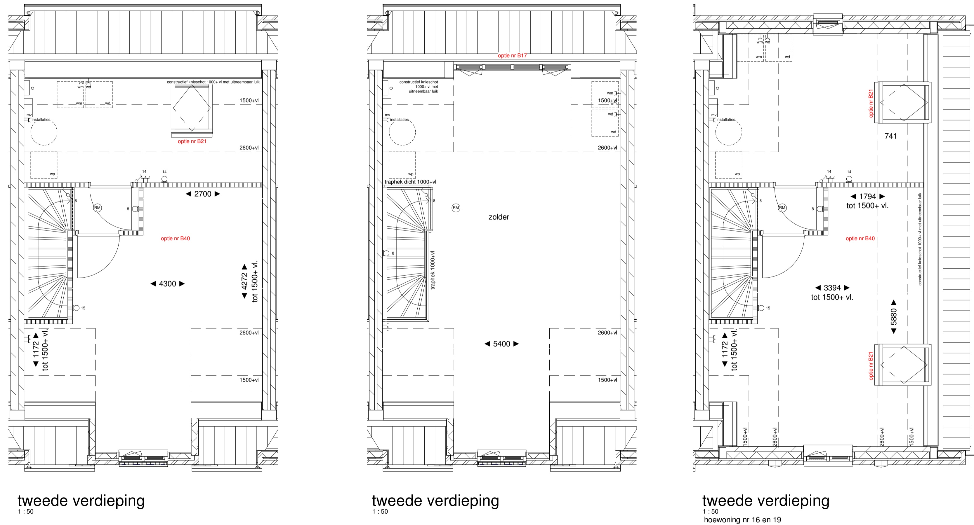
tweede verdieping 1:50